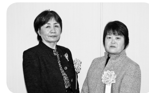
かあちゃんキッチン (日光2丁目)

農協市場日光店で農家レストランを経営し、メンバーが栽培した野菜や、市内で採れる地場産食材を使った手作りの惣菜・日替わりランチを提供し、地産地消の推進を図っています。