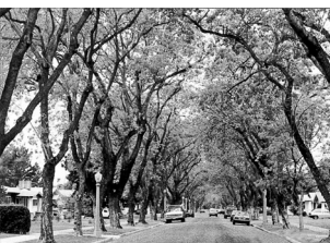
フラトン市の花 ジャカランダ並木