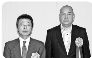
福井市北部エコファーマーズ (高屋町)

市における数少ない女性漁業者の1人であり、地魚の消費拡大に向けて、意欲的な取り組みを行っています。