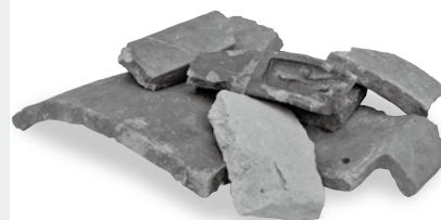
体験発掘で出土した瓦