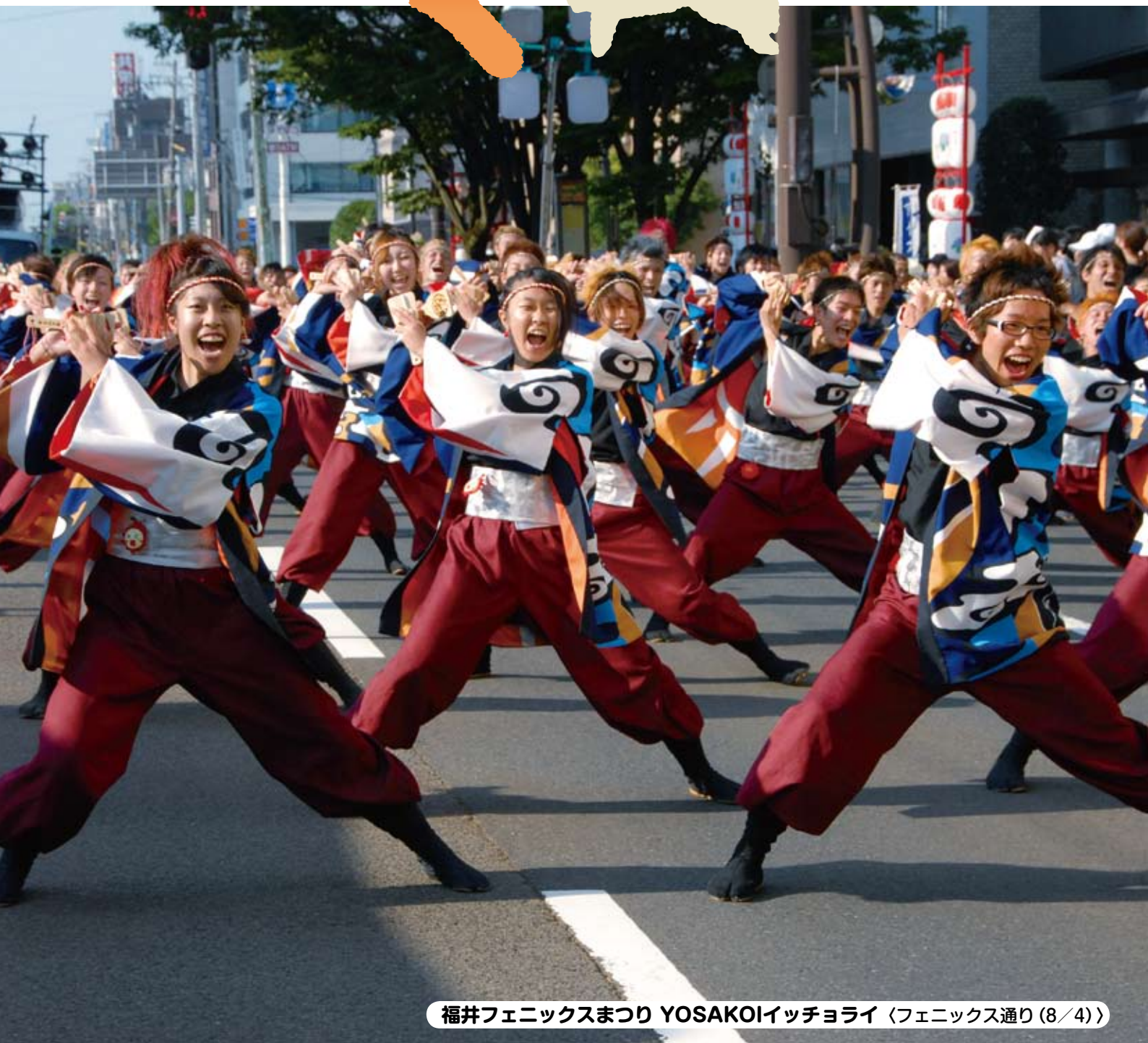
福井フェニックスまつり YOSAKOIイッチョライ 〈フェニックス通り(8/4)〉