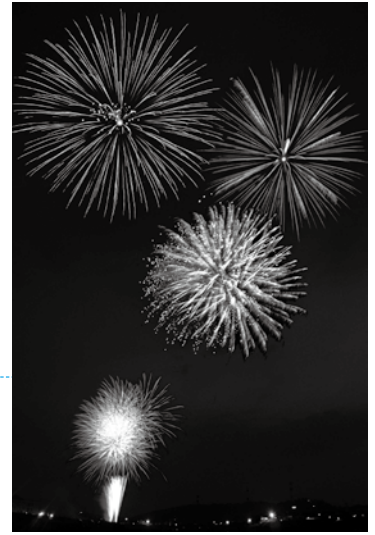
夏の夜空を彩った福井フェニックス花火(多重処理)

8月3日から5日にかけて、福井フェニックスまつりを開催しました。 初日の「福井フェニックス花火」でまつりがスタート。五輪マークの花火や、東京スカイツリーなどを模した仕掛け花火、北陸新幹線をイメージした300mのナイアガラ花火など、さまざまな「想い」が込められた花火7800発が夏の夜を演出しました。来場者は、大きな歓声を上げたりカメラで撮影したりして楽しんでいました。 2日目は、フェニックス通りで「民踊・YOSAKOIイッチョライ」を開催。猛暑の中、華やかな衣装に身を包んだ約3500人が力強く舞い踊り、観客を魅了しました。 3日目は、今年で40回目となる「100万人のためのマーチング」を福井競輪場で開催。県内外の27団体が華麗な演技を披露し、まつりの最後を盛り上げました。