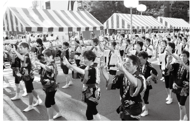
法被や浴衣姿で民踊を披露