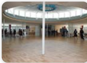
円状に配置された仕切りのない学級教室