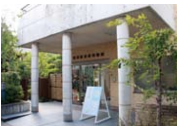
愛宕坂茶道美術館