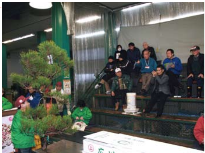
競りにかけられる松を品定めする仲買人や小売業者

12月6日、中央卸売市場で松市が行われました。 松市とは、松だけの競りのことで、毎年1度だけ、この時季に行われる恒例行事です。松は普段の競りではあまり出でこないので、正月に使われる松のほとんどは、この松市で競りにかけられます。 今年用意された松は、県産のほか、茨城県産や秋田県産など、約10種類7万本。7時30分に競りがスタートすると、競り人の「安いよ、安いよ」「買ってこれ」などの威勢のいい掛け声が場内に響き渡りました。 集まった約15人の仲買人や小売業者は、松の枝ぶりや葉の状態を見極めながら、指で値段を示して次々と競り落としていきました。