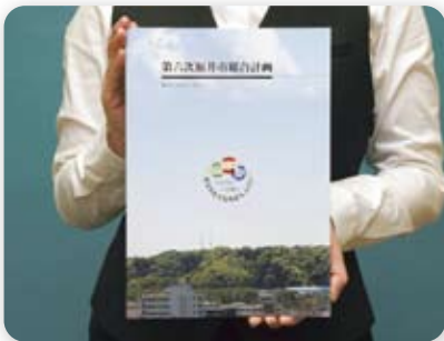
平成24年度から5年間の福井市のまちづくりの指針となる計画