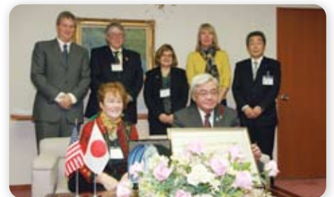
市長を表敬訪問したニューブランズウィック市民訪問団