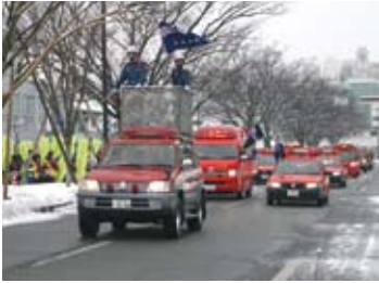
消防車両の分列行進