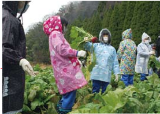
収穫を楽しむ児童たち

12月5日、美山啓明小学校の3・4年生の児童が、西市布町の畑で美山地域の伝統野菜「河内赤かぶら」を収穫し、酢漬けに挑戦しました。 この体験は、郷土学習の一環で行ったもので、河内赤かぶら生産組合などの協力を得て初めて実施。 収穫では、雨の中、かっぱに長靴姿の児童たちが、元気よくカブラを引き抜いていました。参加した児童は「大きいカブラを探るのが難しかったけど、たくさん採れてうれしい」と笑顔で話しました。 その後、学校に戻った児童たちは、生産組合の組合員に教えてもらいながら、カブラを薄切りにして、塩や酢、砂糖で漬け込みました。酢漬けにしたカブラは、年明けの給食で食べる予定です。