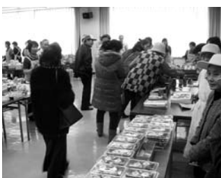
昨年(2012年)のバザーの様子