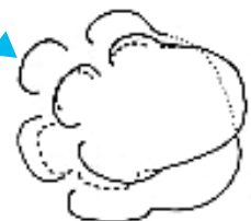
推定した前足と後ろ足の足跡