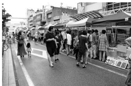
7月のまちフェスの様子

※詳しくは、まちづくり福井(株)のホームページ(http://www.fmo.co.jp/)をご覧ください。