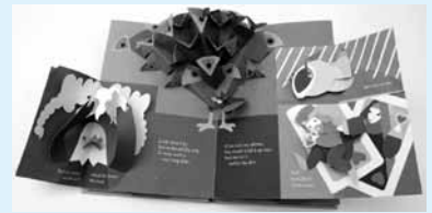
絵本 「マザーグース」