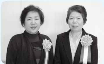
JA福井市女性部 営農部会 (洲4丁目)

昨年度から、食の安全にこだわった「女性ブランド野菜づくり」の確立と、地産地消を柱とした、ショウガづくりを始めました。今年度は698人のメンバーが、学習会や先進地視察研修会を行いながら、栽培技術と品質の向上を図っています。 また、加工品の開発やPR活動にも積極的に取り組む、「生姜しょうゆ」の販売や、イメーシキョウクターの作成、ショウガレシピコンテストの開催など、地域の活性化と6次産業化の推進に貢献しています。