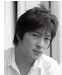
細川 茂樹 さん

コース 県庁→駅前電車通り→西武前→大名町交差点→中央大通り→九十九橋→足羽川左岸河川敷 (約1.5km)