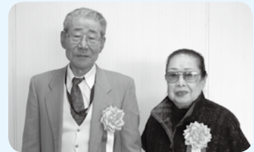
殿下の里づくり組合 (島中町)

「農園たや」で、生ごみなどで作った堆肥で土づくりを行い、ベビリーフを中心とした50品目以上の野菜を、ほぼ100%有機肥料で栽培しています。自然のエコシステムを利用した減農薬栽培を行い、生物保全に努め、近年は加工品づくりも手がけています。 また、広告やホームページなどを利用してPRし、旬の野菜を詰め合わせた「おまかせ便」のネット販売なども行っています。 さらに、若手農業者とともに勉強会「田谷ゼミ」を開催するなど、栽培技術やマーケティングの研さんに努めています。