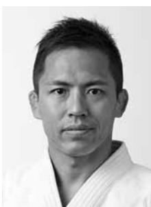
野村 忠宏 氏