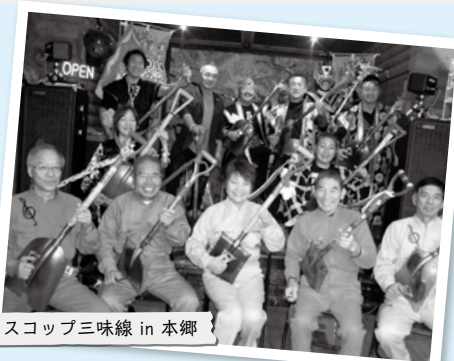
スコップ三味線 in 本郷