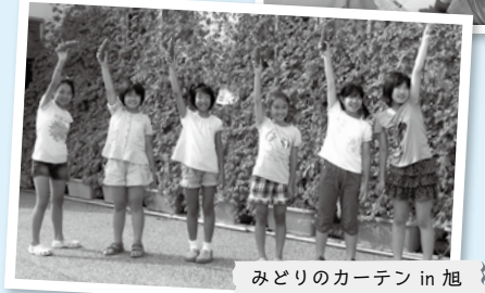
みどりのカーテン in 旭