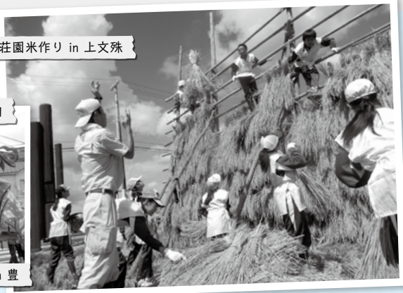
荘園米作り in 上文殊