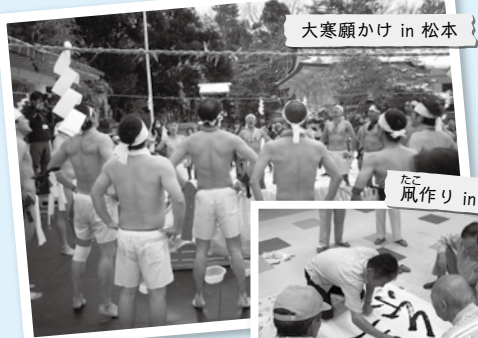
大寒願かけ in 松本