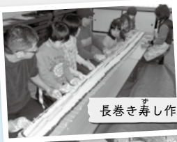
長巻き寿し作り in 木田