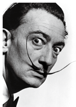
「Dali's Mustache シリーズ」より

ダリは、6歳の頃から絵画で驚くべき才能を見せ、本格的な美術教育を受けます。22歳の時にマドリードの美術学校を退学になり、翌年パリに出て、ピカソやミロと出会います。やがて彼は、無意識下の世界を表現するシュルレアリスム（超現実主義）運動に参加し、この運動を代表する美術家となっていきます。