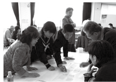
小中学生とのワークショップ

まちづくりは地道で、気長に続けるものだと考えていますので、あせらず課題を解決していきたいですね。地区の宝である人材を大切にしながら、これからも後世に安居地区の良いところを伝え続けたいと思っています。