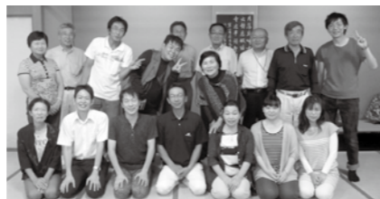
婚活イベント実行委員の皆さん

このことに限らず、少しの勇気を持って行動することは非常に大事だと思います。福井の女性は、控えめな人が多いですが、女性が活躍する社会を作っていくには、私たち女性が半歩でも前に出ていくこと。そうすれば、夫や家族をはじめ、周りの男性たちの意識も変わり、協力や支援が得られるのではないのでしょうか。