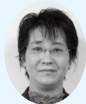
なつめ 棗の里農産 (小幡町)

食育の一環として、地元の小学生を対象に、農作業や納豆づくりの体験指導なども行っています。