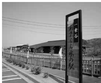
一乗谷あさくら水の駅