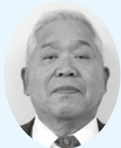
三留生産組合 (三留町)

市では、優れた取り組みを行っている農林漁業者を表彰しています。今年度は、2団体1個人が受賞しました。