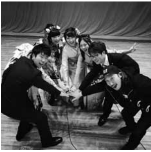
平成27年の実行委員