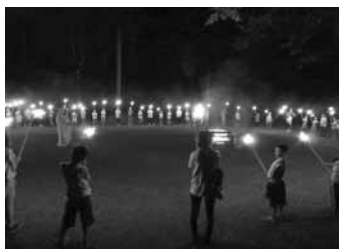
昨年のキャンプファイヤー

講座名、郵便番号、住所、氏名(ふりがな)、性別、学校名と学年、年齢、保護者の氏名、日中に連絡がとれる電話番号をお知らせください。