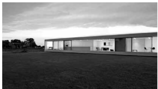
部門賞(まちなみ部門) M RESIDENCE (藤島町) 南側全面の窓から東藤島地区の自然豊かな四季折々の風景を楽しめます

周りの景観に調和した建造物や、地域住民の活動によって守られている風景を募集したところ、79件の応募がありました。その中からまちなみ部門、風景部門で、部門賞、奨励賞を各1点、福井県建築士会長賞、福井県造園協会会長賞を各1点決定しました。