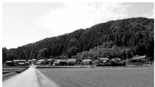
部門賞(風景部門) 城山と麓の集落(杉谷町) 妻面を格子にした伝統的民家や窓枠、壁などに意匠をこらした蔵などが残る田園風景です