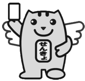
選挙のめいすいくん