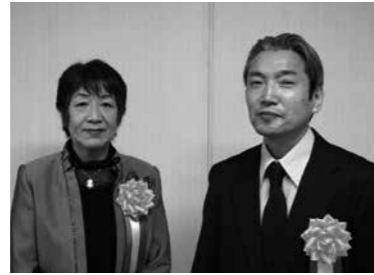
株式会社 キヨカワ (和田中1丁目)

県内初の食肉処理加工施設を建設し、安全安心で質の高い獣肉を生産。農作物被害の軽減、廃棄物の有効活用、地域活性化につながる先進的な取り組みを行っています。ジビエ人気は全国的に広がっており、県外にも出荷しています。