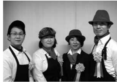
ベジラボ。 (板垣2丁目)

メッキ加工業で培った技術とノウハウを生かし、植物工場を設立。無農薬で高品質なハーブを生産し、県内外へ出荷しています。また、ドライハーブやハーブ塩などの加工品も各方面から高い評価を受け、企業の農業参入のモデルケースとなっています。