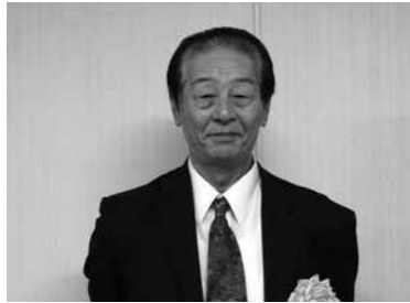
ふくいウエストサイド ジビエの会 (宿堂町)

市では、優れた取り組みを行っている農林漁業者を表彰しています。今年度は、次の3団体が受賞しました。