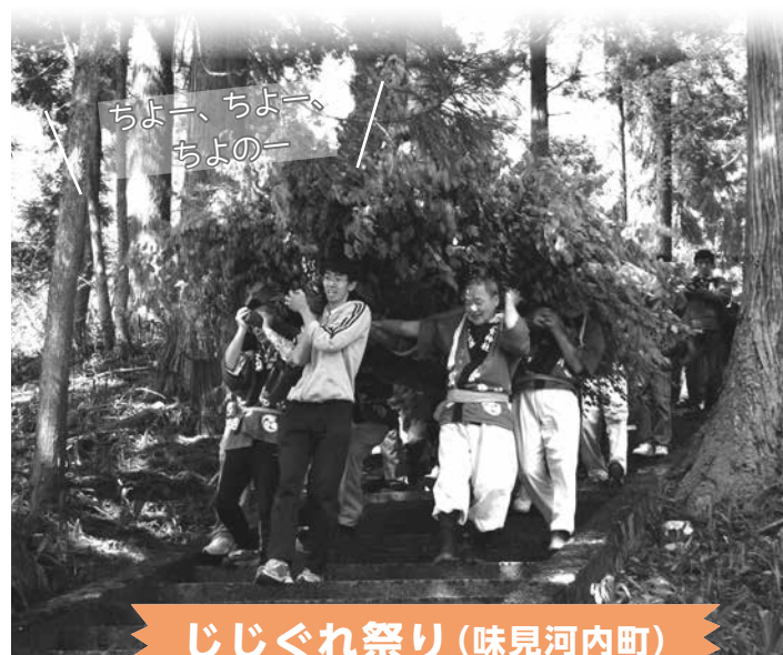
じじぐれ祭り (味見河内町)

ブナ、シデなどの木で作った柴みこしを担いで町内を巡行します。祭りの最後に、みこしを豪快に解体します。