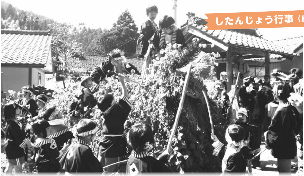
したんじょう行事 (鹿俣町)

「したんじょう」と声を上げながら町内を練り歩き、大イノシシを退治する様を演じます。 じかん 12時～15時 問合せ 一乗公民館 ☎43・2001