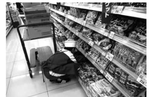
食料品店での職業体験