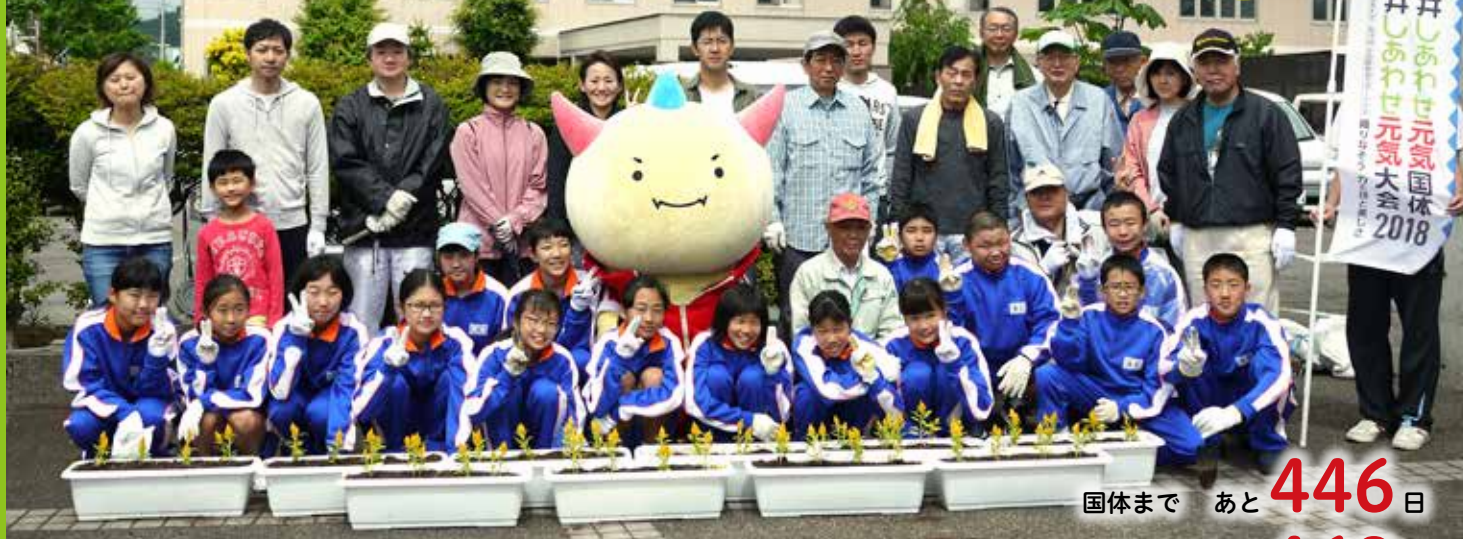
明倫中学校と地区の有志のみなさんで、ケイトウを植えました (5月27日、木田地区)