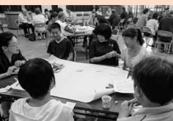
地域の未来を語る会