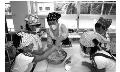
地元食材で地域の方と調理実習

そこで、市では現在、家庭・地域・学校・企業と連携し、義務教育9年間を見通して一貫したキャリア教育を行えるよう、キャリア教育プログラムの策定を進めています。これまで行ってきた企業、団体などと連携した職場体験活動に加え、各教科の学習や各種活動、地域行事への参加など、社会や職業に関わるさまざまな体験的な学習活動をしていきます。