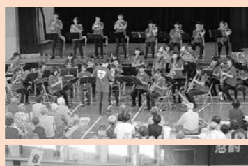
地域の社会福祉施設との交流

放送や競技運営の手伝い、「一中のお店」を出店。生徒自身が区民体育祭への出店に向けて事前に話し合い、準備します。