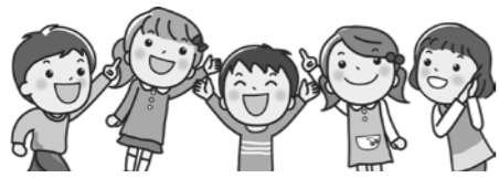
【第50回記念大会の様子】