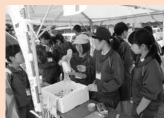
区民体育祭ボランティア

放送や競技運営の手伝い、「一中のお店」を出店。生徒自身が区民体育祭への出店に向けて事前に話し合い、準備します。