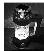
ソーラーランタン