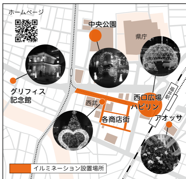
※写真は昨年のものです。

とき 11月2日(木)～平成30年1月8日(月祝) ところ 福井駅周辺、ハピリン、アオッサ、駅前各商店街、アップルロード、中央公園、グリフィス記念館