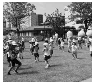
中央公園周辺再整備事業 3億6,511万円

福井市の魅力や暮らしに関わるさまざまな情報を全国に発信し、移住・交流など福井市への新しい人の流れづくりを展開しました。