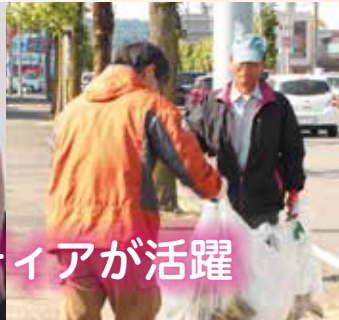
ボランティアが活躍