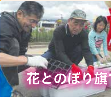
花とのぼり旗で歓迎