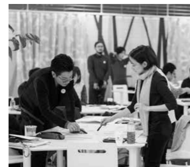
ふくい魅える化プロジェクト 5,495万円

平成 28 年 4 月に開業した福井駅西口再開発ビル「ハピリン」を拠点とした賑わいを創り出すため、さまざまなイベントや広報活動を行いました。