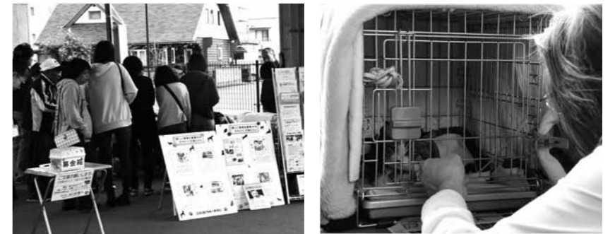
譲渡会の様子。この日は11匹の猫が参加しました