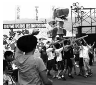
地域の魅力発信事業 4,585万円

放課後留守家庭児童に遊びや生活の場を提供し、保護者が安心して働ける環境をつくるため、放課後児童会・クラブを充実させました。