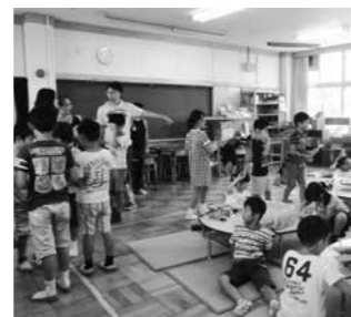
放課後児童健全育成事業 4億5,366万円

第 1 期工事エリアとして、芝生広場やビジターセンター「御座所」などを整備し、供用開始しました。