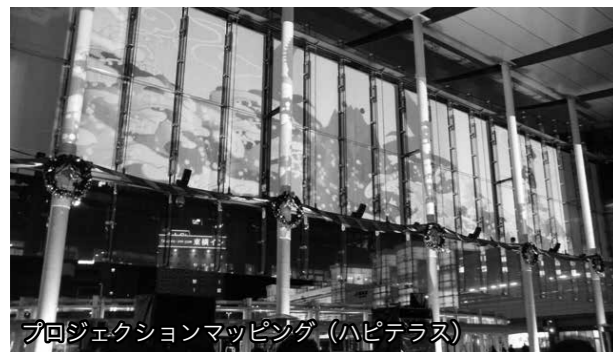
ハピリンステップアップ事業 2,112万円

平 成 30 年の福井国体開催やその後の新幹線県内延伸を見据えた県都としての魅力を高める事業など、さまざまな政策について、重点的かつ効率的に取り組みました。