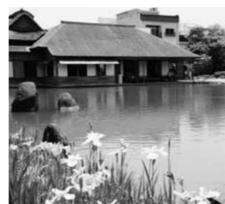
名勝 養浩館庭園 魅力向上事業 925万円

連携・協働のまちづくりを進め、地域の課題解決や魅力発信につなげるため、地域の特色を生かしたまちづくり活動を支援しました。