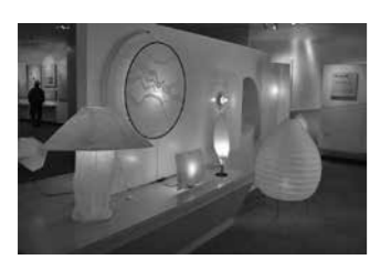
美濃和紙あかりアート館