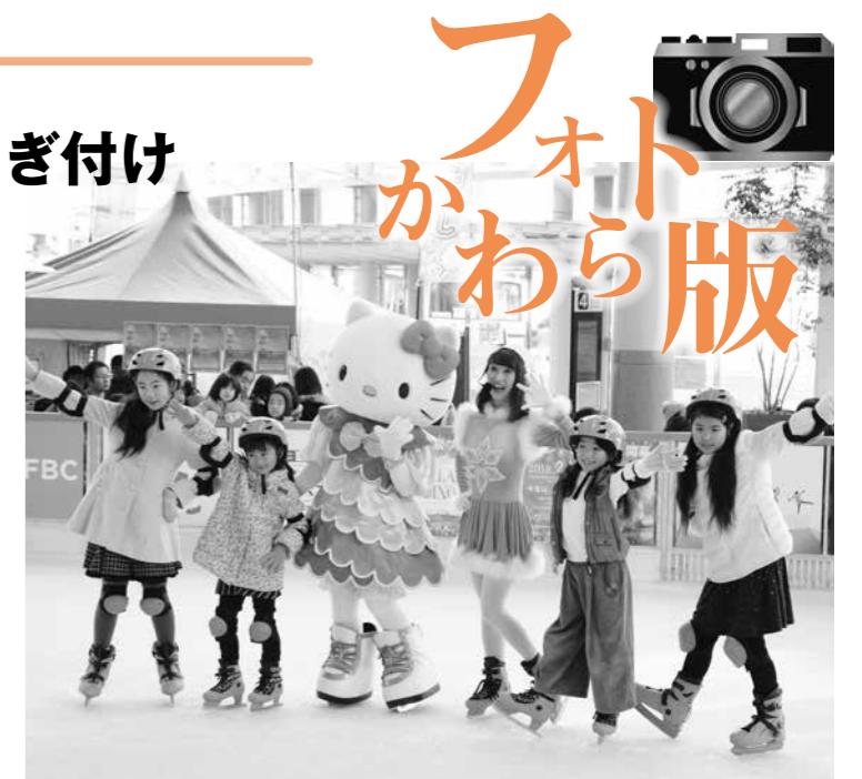
ハローキティとポーズを決める子どもたち