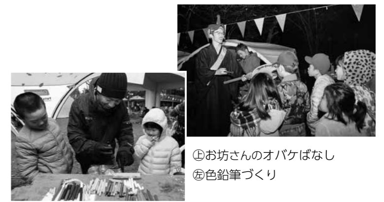
①お坊さんのオバケばなし ②色鉛筆づくり