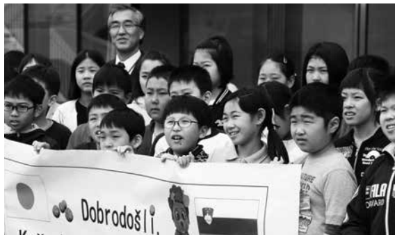
④スロベニア語で「ようこそ」と書かれた横断幕

4月17日、スロベニア共和国のバスケットボール連盟の訪問団が、東京オリンピック事前キャンプの候補地を視察するため、福井県営体育館を訪れました。 スロベニア語の横断幕を掲げて訪問団を歓迎したのは、社西小学校の5年生たち。出迎え時に設けられた質問タイムでは、身長やプロリーグでの経験など、好奇心いっぱいの質問が飛び出しました。 市は昨年12月、スロベニア共和国のホストタウンに登録されており、スポーツ交流のほか、教育や文化の分野での交流も進めていきたいと考えています。