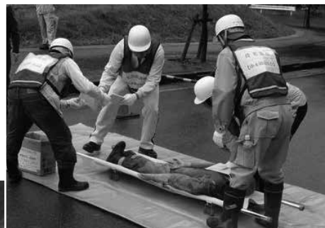
本郷地区での訓練の様子