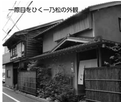
一際目をひく一乃松の外観