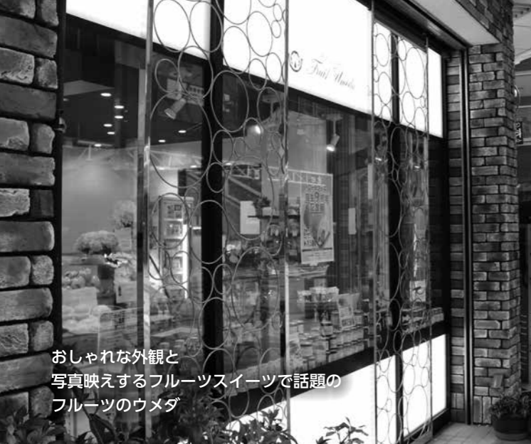
おしゃれな外観と写真映えするフルーツスイーツで話題のフルーツのウメダ