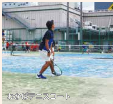
わかばテニスコート