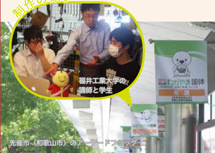
福井工業大学の講師と学生