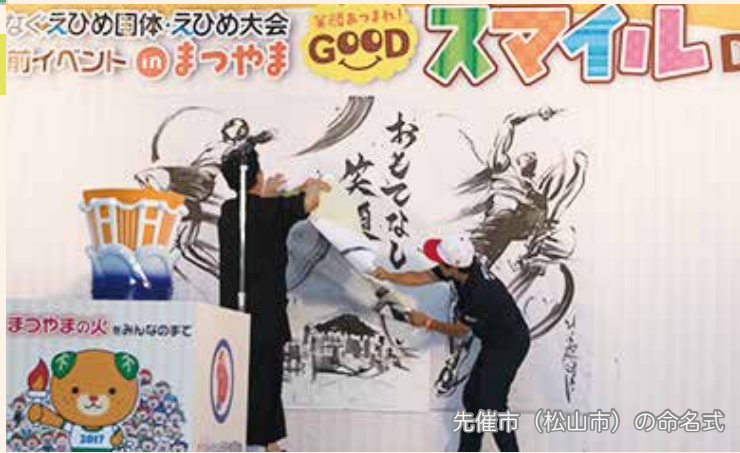
先催市（松山市）の命名式