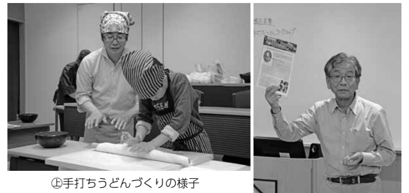
①手打ちうどんづくりの様子