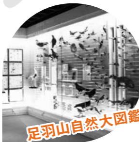
足羽山自然大図鑑