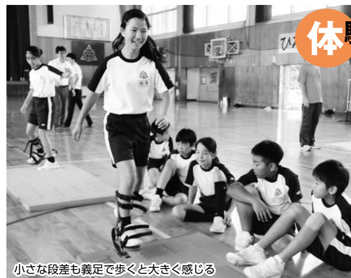
小さな段差も義足で歩くと大きく感じる