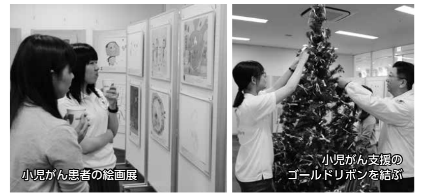
小児がん患者の絵画展 小児がん支援のゴールドリボンを結ぶ