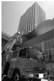
はしご車搭乗体験