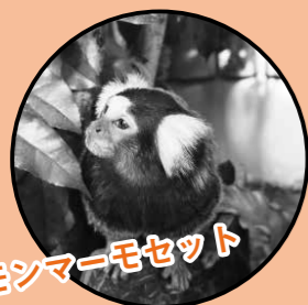
コモンマーモセット