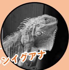
グリーンイグアナ

大きくなると全長約2mにまで成長。性格は温厚で頭が良く、人の顔を覚えたり簡単な言葉を理解したりします。