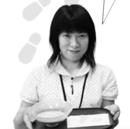
愛宕坂茶道美術館 職員