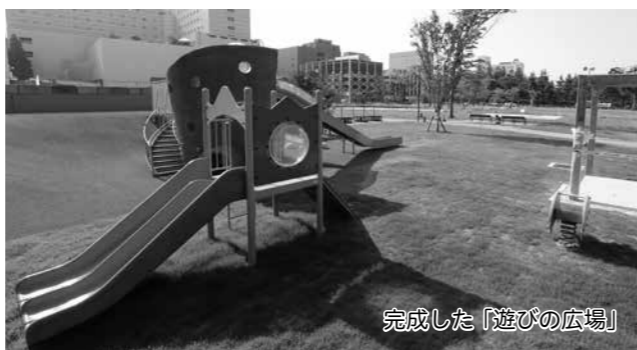
完成した「遊びの広場」

中央公園は、福井城址を中心とした、歴史を象徴し、人が集まる空間づくりをコンセプトに再整備してきました。一昨年には、ビクターセンター「御座所」などが完成し、すでに多くの皆さんに利用されています。