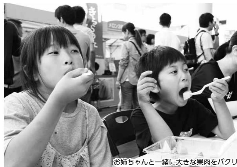
お姉ちゃんと一緒に大きな果肉をパクリ

6月23日、24日、ハピテラスで、花咲ふくい旬菜フェスタふくいメモロニまつりが行われました。 福井県産メロンは全国11位の生産量を誇ります。2月の大雪の影響でこの日までに収穫できなかった品種もあるものの、「花咲乙女」や赤肉の「花咲紅姫」など8種が勢ぞろい。ワンコインで試せるカットメロン3種の食べ比べやメロンを使ったスイーツなどのブースが並びました。 2日間で1万4000人が来場し、食べ比べて自分好みの品種を見つけるなど、旬のメロンに舌鼓を打っていました。