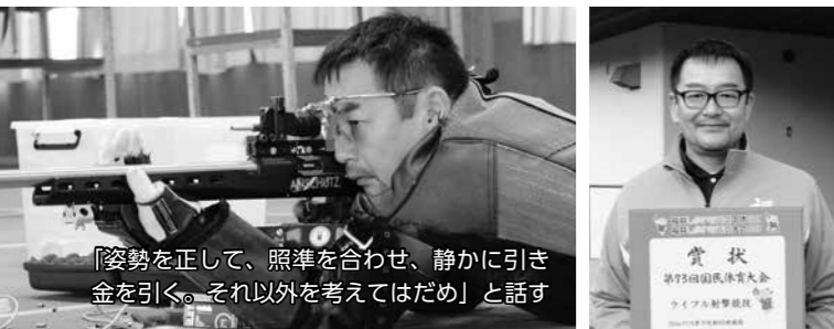
「姿勢を正して、照準を合わせ、静かに引き金を引く。それ以外を考えてはダメ」と話す

美術教諭として県立福井商業高等学校で勤務。専門は映像、写真、デザイン。市展、県展の審査員も務める。空気銃から始め、14年ほど前からライフル射撃へ。国体では、成年男子50mライフル伏射60発で、予選、決勝共に日本新記録を出して優勝。