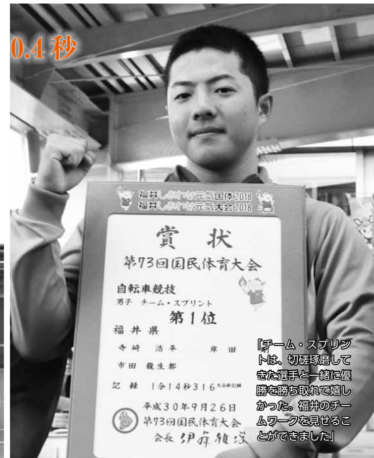
「チーム・スプリントは、切磋琢磨してきた選手と一緒に優勝を勝ち取れて嬉しかった。福井のチームワークを見ることができました」