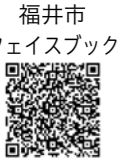
福井市フェイスブック