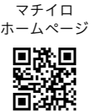
マチイロホームページ