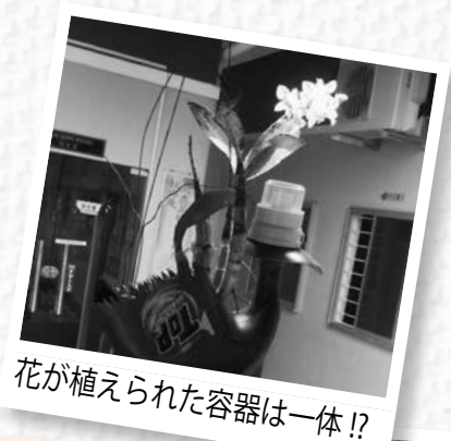
花が植えられた容器は一体!?