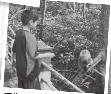
野生のサルと人との共生