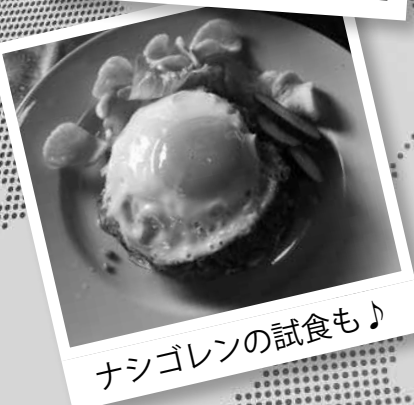
ナシゴレンの試食も♪