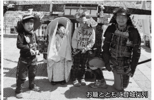
お籠とともに登城行列