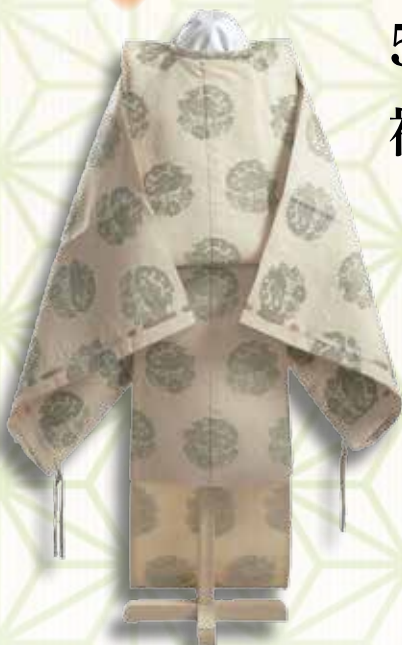
孝明天皇御料狩衣