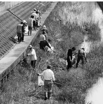
未更毛川クリーン作戦

安 居地区の未更毛川流域では、たくさんのゲンジボタルが乱舞します。夜遅くにしか見ることができないので、大人に連れて行ってもらわないと子どもたちは見ることができません。そこで、安居の子どもたちに、自分たちの地区のホタルを知ってもらおうと、平成13年から観察会をはじめました。 ホタルの数は自然災害などに左右されることも分かってきたため、人工飼育にもチャレンジするようになりました。平成17年から自宅で試験的に飼育を始め、平成21年からは、成虫を捕まえて、公民館で産卵させ、ふ化した幼虫を未更毛川に放流しています。 ホタルがすむ美しい川を守ろうと、毎年、「未更毛川クリーン作戦」