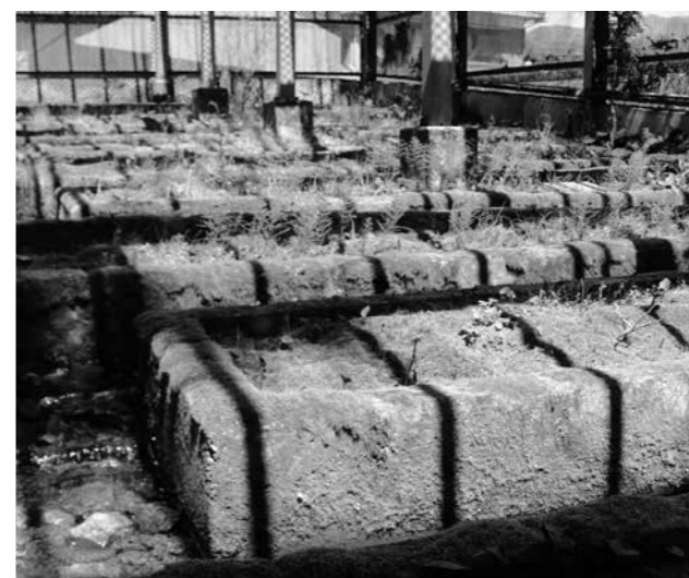
一面コケに覆われた飼育場の中に水路が張り巡らされている

ろではなくなっていました。翌年の夏、手つかずの飼育場の中で数匹のホタルが舞いました。ホタルはちゃんと命をつないでいたんです。あのホタルがいなかったら、飼育はやめていたでしょうね。 現在も河川の復旧工事が続いているため、まだ以前のような光景を見ることはできませんが、いつかまた一乗谷にホタルが舞うように、現在も飼育活動を続けています。