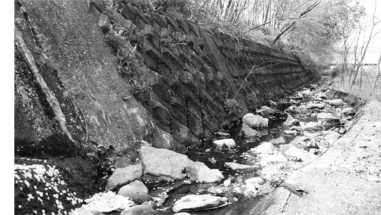
狐川の脇に放流された幼虫は、まゆをつくる土を求め、壁を這い上る