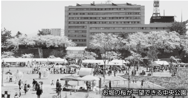
お堀の桜が一望できる中央公園