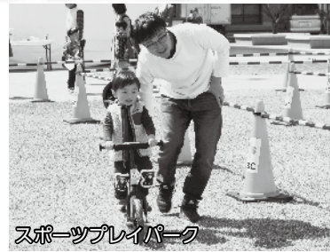
スポーツレイパーク

4月6日、昨年リニューアルした福井市中央公園で、「ふくい桜満喫フェスティバル」が初開催されました。数日前までの悪天候から一転、暖かな陽気にめぐまれた当日は、桜がまさに見頃。お堀に浮かぶ舟の上から桜を遊覧できる桜舟や、甲冑を着物を着て天守台を目指す登城行列などの体験型イベントのほか、桜にちなんだ和菓子や福井の食の販売などが行われました。特に、ウサギやモルモットとのふれあいコーナーや、巨大バルーンの中に入って遊べるアトラクションなどは、子どもたちに大人気で、大勢の家族連れでにぎわいました。