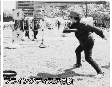
フライングディスク体験