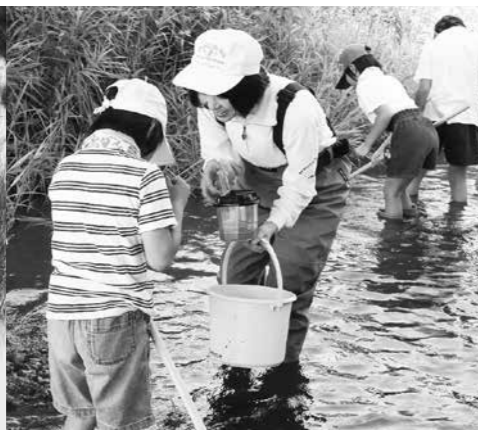
毎年子どもたちが川の生き物と水質調査を行う