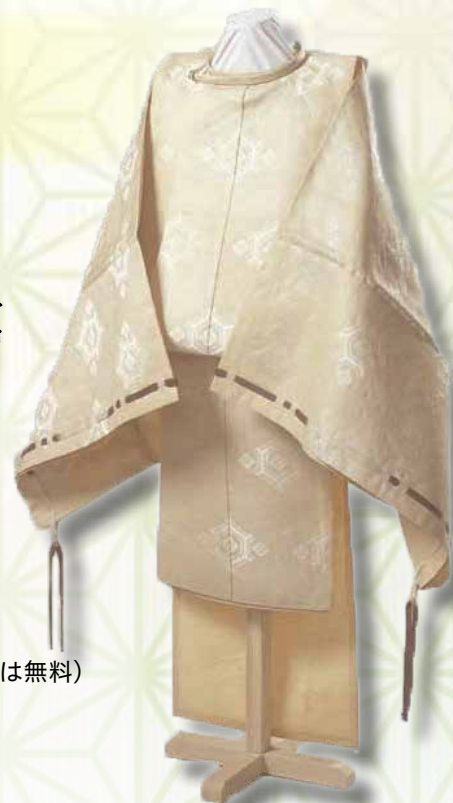
明治天皇御料狩衣