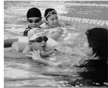
泳ぎを楽しむ子どもたち