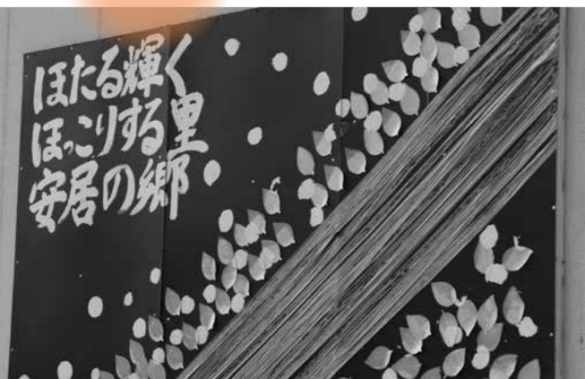
公民館の正面にかかる未更毛川をモチーフにした大きな看板

安 居地区の未更毛川流域では、たくさんのゲンジボタルが乱舞します。夜遅くにしか見ることができないので、大人に連れて行ってもらわないと子どもたちは見ることができません。そこで、安居の子どもたちに、自分たちの地区のホタルを知ってもらおうと、平成13年から観察会をはじめました。 ホタルの数は自然災害などに左右されることも分かってきたため、人工飼育にもチャレンジするようになりました。平成17年から自宅で試験的に飼育を始め、平成21年からは、成虫を捕まえて、公民館で産卵させ、ふ化した幼虫を未更毛川に放流しています。 ホタルがすむ美しい川を守ろうと、毎年、「未更毛川クリーン作戦」