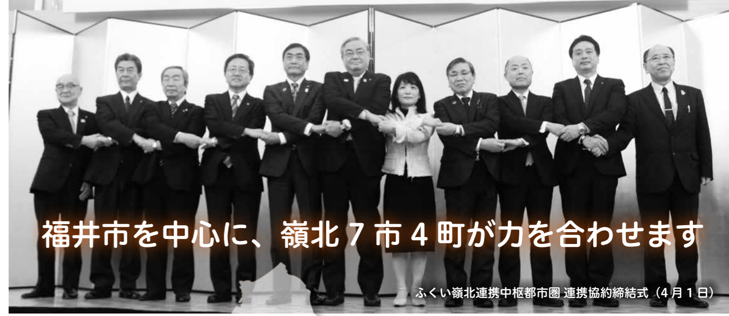
福井市を中心に、嶺北7市4町が力を合わせます