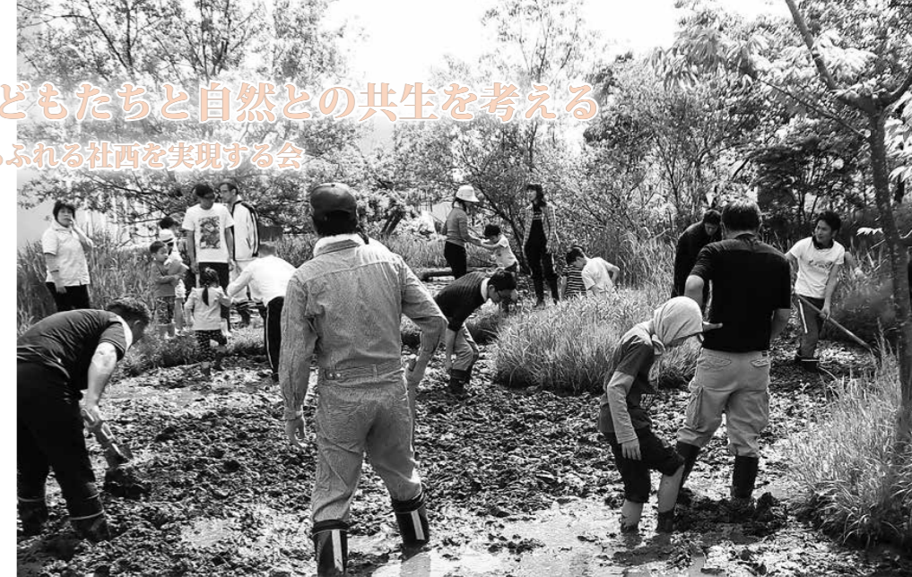
ピオトープにある水田では、無農薬で有機肥料にこだわった古代米づくりにもチャレンジ

地 区の子どもたちが、ホタルの成育を通じて、自然に親しみ、環境の大切さを理解できるように、社西小学校の敷地の一面にピオトープ（生物生息空間）ができたのは、平成14年。このピオトープは設計から実際の工事までを、小学校とPTA、地域が一緒に行いました。中には重機や、その操作、左官など、特殊な機械や技術を無償で提供してくれる事業所やボランティアもいて、