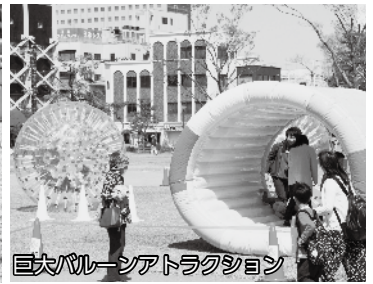
巨大バルーンアトラクション