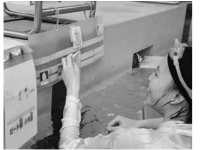
練習内容を絵入りのカードで確認