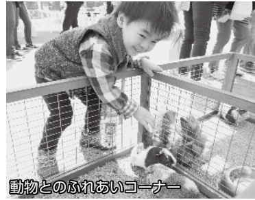
動物とのふれあいコーナー