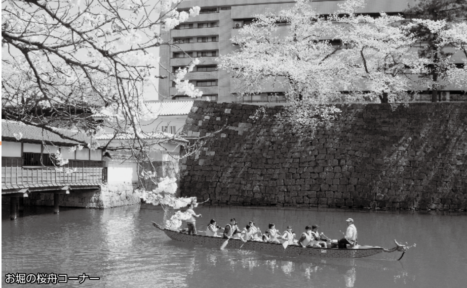
お堀の桜舟コーナー