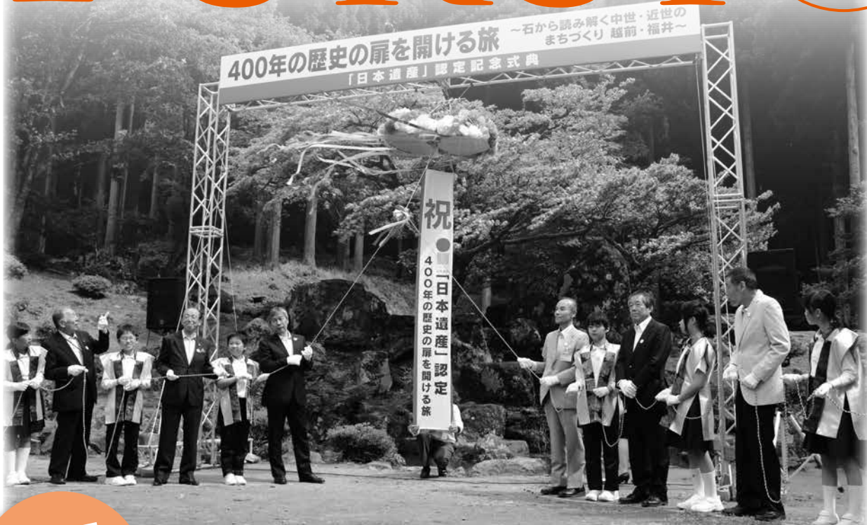
日本遺産認定記念式典（5月20日・一乗谷朝倉氏遺跡）