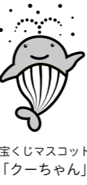
宝くじマスコット「クーちゃん」

市町村振興宝くじサマージャンボの収益金は、地域の明るく住みよいまちづくりに使われます。宝くじは、ぜひ県内で購入してください。 ◆サマージャンボ 1等前後賞合わせて7億円 ◆サマージャンボミニ 1等前後賞合わせて5000万円 発売期間 7月2日(火)～8月2日(金) 問合せ (公財)福井県市町振興協会 ☎57・1633