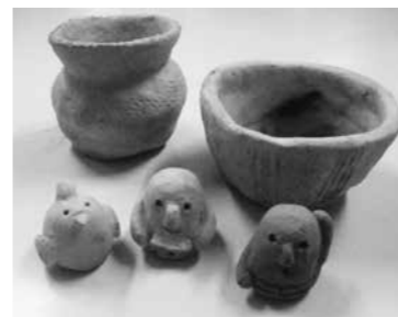
土器作りで作った作品

とき 3月14日(日)9時～12時 ◎いずれも… 問合せ・ところ 文化財保護センター(洲4丁目) ☎ 35・1015 FAX 35・1017