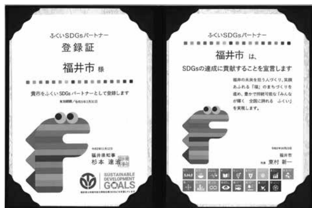
ふくい SDGs パートナーの登録証と宣言

市は、県が創設した「福井県 SDGs パートナースhip会議」に参加し、SDGs の達成に貢献することを宣言しました。今後は、県内の企業や団体、教育・研究機関、NPO、他の自治体など