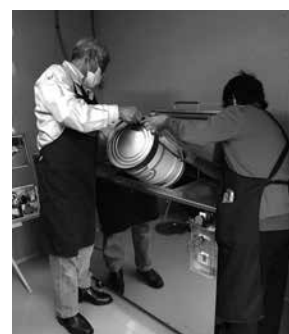
微生物の力で生ごみを発酵

この補助金を活用し、清明地区では、ごみの減量や資源循環に取り組む(特非)せいめい夢ファーム会が、住民・事業者・行政などさまざまな関係者とのパートナーシップを拡大し、新たに「生ごみ処理機」を導入しました。