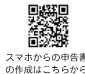
スマホからの申告書の作成はこちらから

2か所以上の給与所得がある人や、年金収入、副業などの雑所得がある人もスマートフォンでも申告書を作成できます。