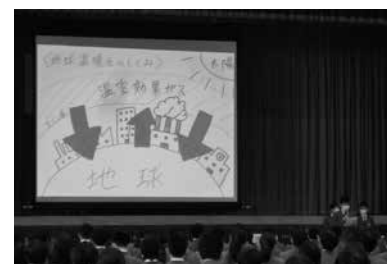
学習成果発表会で学習の成果を報告

社中学校では、「世界と共に生きる」をテーマに SDGs について学習しています。世界で起きているさまざまな問題について学び、班に分かれて SDGs の各目標をより深く探究。「My SDGs 行動宣言!」として、自分たちにできることは何かを考え、飢餓をなくすための募金をする、数値で可視化しながら水・電気・紙を節約するなど、具体的な解決策を実践しています。