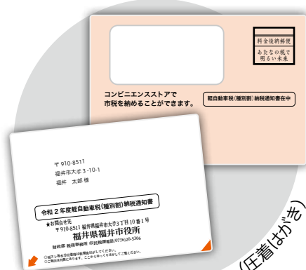
今までの納税通知書 (圧着はがき)

納税通知書の様式が、圧着はがきから納付専用紙 (横長) に変わります。納税通知書は、黄色い封筒に入れて、5月7日から順次発送します。