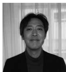
(一社)こしのくに 里山再生の会 (水谷町)

市の農林水産業発展のため、優れた取り組みを行っている農林漁業者などを表彰しています。令和2年度は、次の1団体と1名が受賞しました。