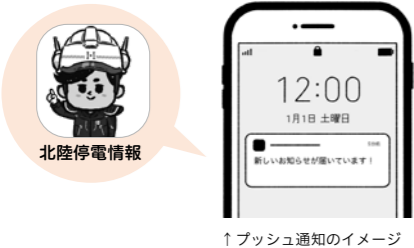
↑プッシュ通知のイメージ

設定した地域(最大12地域)の停電、復旧見込み時刻などを、プッシュ通知でお知らせします。