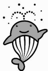
宝くじマスケットクーちゃん