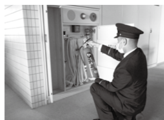
昨年の防火査察の様子

市民の皆さんは、日頃から火気取り扱いに注意し、降雪時には近くの消火栓の除雪にご協力をお願いします。