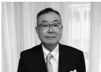
三里浜オリーブ生産組合 (白方町)

三里浜砂丘地で、耕作放棄地の解消や新たな特産品の創出などを目的に地元有志が集まり、オリーブ栽培を開始。収穫した実をオイルや塩漬けなどの加工品にしています。収穫祭の開催など、PR活動にも積極的に取り組んでいます。