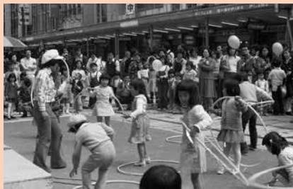
子どもたちの遊び場としてもにぎわいを見せた

とに新しい流行を取り入れた催し物などで盛り上がりを見せました。やがて昭和50年代になると、福井の商業は、駅前地区、郊外型ショッピングセンター、郊外専門店群の三極が競合する時代に移り変わっていきます。長年多くの市民に愛された日曜広場は、昭和57年を最後に、その幕を閉じました。