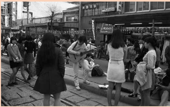
現在のオーオカ薬局駅前本店付近でギターを演奏する若者