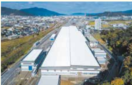
敦賀駅から南に約2kmの位置にある敦賀車両基地

北陸新幹線には、現在、長野県長野市と石川県白山市に車両基地があります。来年敦賀にも新たに基地が開業予定。変電所などを含めると約12ヘクタールもある広大な敷地内で、折り返し列車の収容や車両点検などを行います。