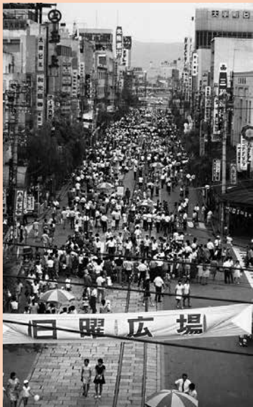
多くの人であふれかえった電車通り