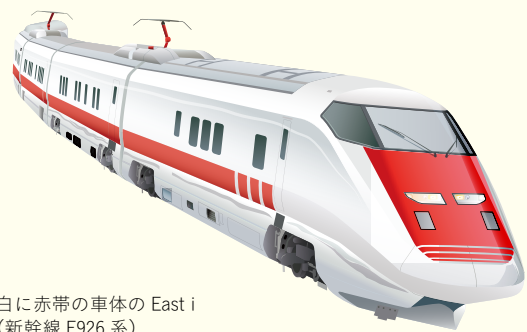
白に赤帯の車体のEast i (新幹線 E926系)

新幹線には線路や架線を検査しながら高速で走る点検車両があります。北陸新幹線では「East i」と呼ばれる車両が、10日に1回くらいの頻度で、時速260kmで走行しながら、レールに傷やゆがみがないかなどをチェックします。