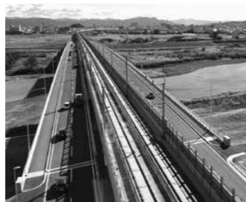
九頭竜川橋りょう