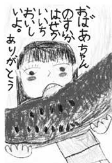
令和4年度「家族ふれあい」絵手紙コンクール最優秀賞(福井市教育委員会賞)