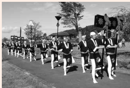
昨年の時代お練りの様子

一乗谷が幻の都となって今年で450周年。その歴史を受け継ぐ地元地区の文化活動グループによるステージなどのイベントです。