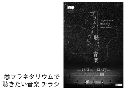
⑥ プラネタリウムで聴きたい音楽 チラシ