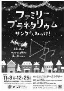
⑤ サンタさんみっけ! チラシ