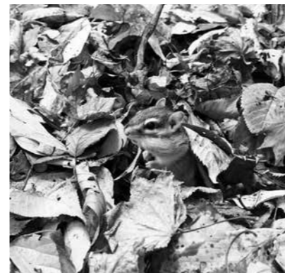
落ち葉プールとシマリス