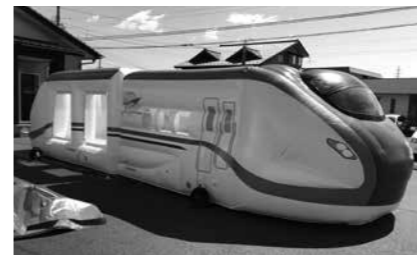
北陸新幹線のふわふわ