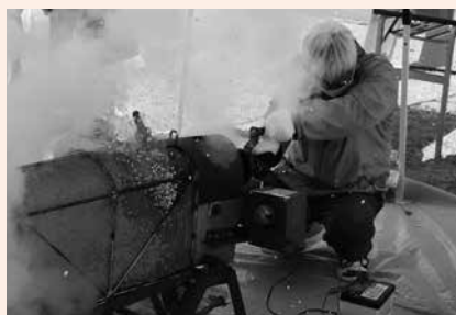
昨年のポン菓子の実演の様子