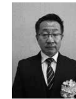
優良施設 ホテルキャッスル 飲食店営業