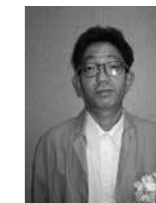
優良施設 ヘアサロン いけだ 理容業