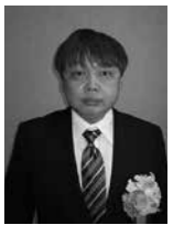
優良施設 ヨーロッパ軒 みゆき分店 飲食店営業