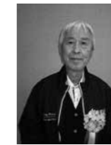
優良施設 そば処裕心 飲食店営業