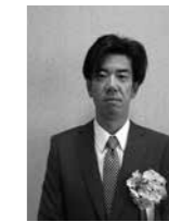
優良施設 安田蒲鉾 魚肉ねり製品 製造業