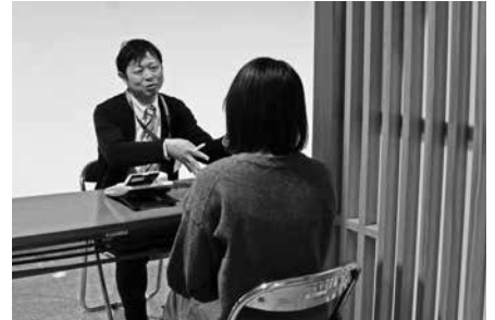
こども家庭センター窓口での相談（イメージ）