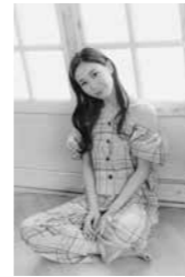
あんざい ちか 安済 知佳

福井県出身。多数のアニメ作品に出演するほか、近年では映画の吹き替えや実写映画など幅広く活躍中。 代表作 ・『リコリス・リコイル』錦木千束 ・『響け!ユーフォニアム』高坂麗奈 など