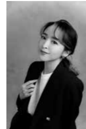
はん めぐみ 潘 めぐみ

福井ゆかりのTVアニメ『ちはやふる』で花野董役を担当。 代表作 ・『推しの子』有馬かな ・『HUNTER×HUNTER』ゴン=フリークス など