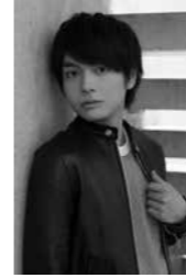
えのき じゆんや 榎木 淳弥

福井県を舞台としたTVアニメ『2.43 清陰高校男子バレー部』で主要キャラクターの黒羽祐仁役を担当。 代表作 ・『呪術廻戦』虎杖悠仁 ・『め組の大吾 救国のオレンジ』十朱大吾 など