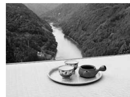
長野県天龍村の中井侍茶