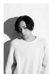
あらい しやうた 蒼井 翔太

福井県出身。声優だけでなく、歌手としてもテレビやミュージカルに出演するなど幅広く活躍中。 代表作 ・『うたの☆プリンスさまっ♪』美風藍 ・『ファンタシースターオンライン2 ジ アニメーション』橘イツキ など