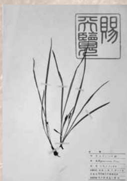
コキンバイザサの標本