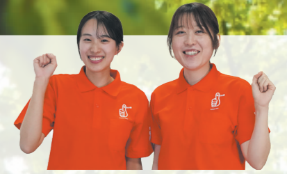
健康管理センター 保健師

暑熱順化のために、家の中で気軽にできるおすすめのエクササイズを紹介しします。やや汗ばむ程度の負荷をかけ、水分補給を忘れないように取り組んでください。