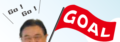
福井市長 西行 茂