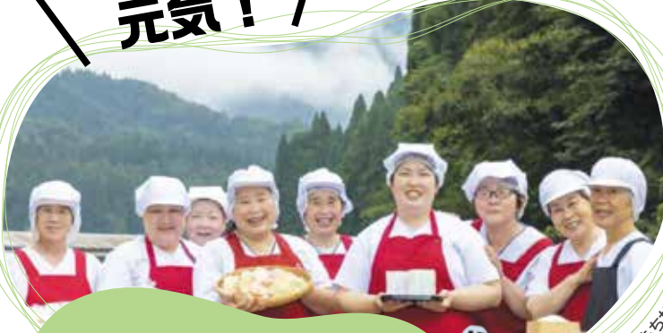
美山のお米で作ったかきもちが評判 米工房ほたるの皆さん

商工、観光、農林水産業の振興、教育の充実、公共交通などに関する事業を紹介しています。