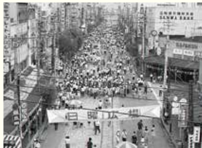
昭和45年の駅前電車通りの様子