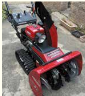
小型除雪機（イメージ）