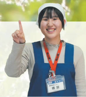
健康管理センター 管理栄養士

暑さに慣れるためには、汗をかくだけでなく、水分や栄養の補給も大事です。汗で失われる水分やミネラル、体力の維持回復の基本となる栄養素を摂取できる、暑さ対策におすすめの料理レシピを紹介します。