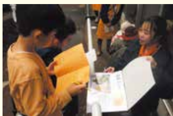
どうぶつクイズラリーの様子