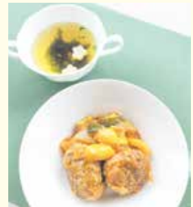
料理の出来上がりイメージ