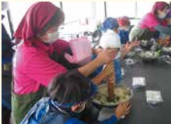
おはぎ作り体験の様子