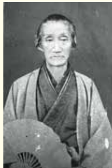
吉田東篁肖像写真