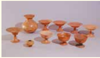
原目山1号墓出土土器