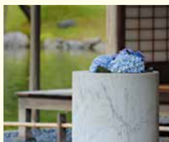
御茶屋建物とあじさい