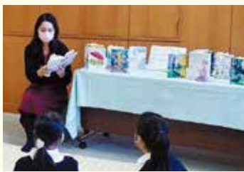
過去のお薦め本ブックトークの様子