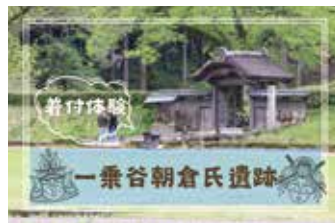
まるっと福井体験

6月は、福井サクッと INFO 「市長ビジョンロードマップ進捗報告—ふくいを『楽しい!』『安心!』『元気!』なまちに—、まるっと福井体験「戦国のまちを歩く—乗谷朝倉氏遺跡体験記—」を放送します。