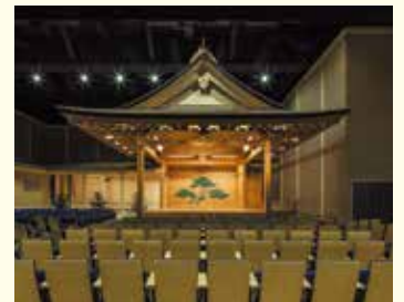
多目的ホール 能舞台の様子