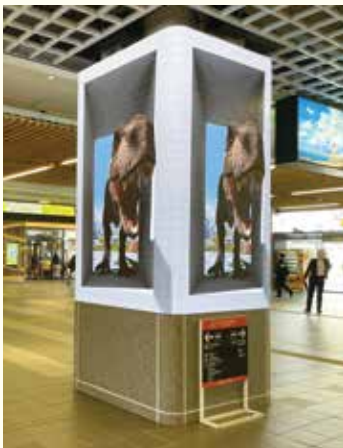
写真を放映するLEDビジョン

問合せ・申込先 広報プロモーション課 TEL 20-5257 FAX 20-5438