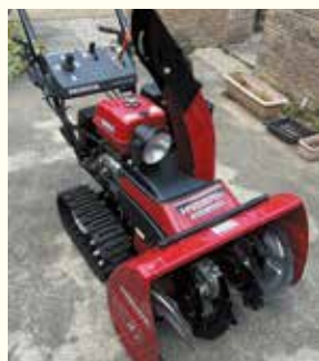
小型除雪機 (イメージ)