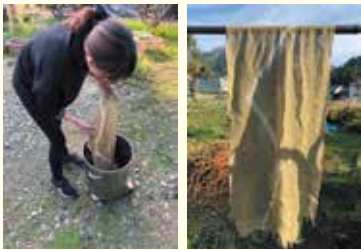
ヨモギ染めの様子