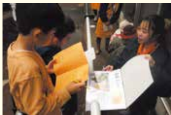
どうぶつクイズラリーの様子