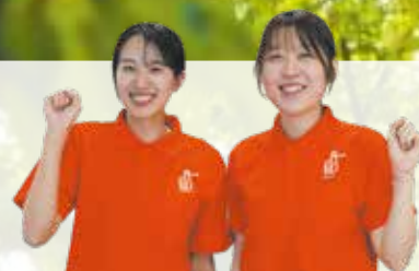
健康管理センター 保健師

暑熱順化のために、家の中で気軽にできる おすすめのエクササイズを紹介します。 やや汗ばむ程度の負荷をかけ、水分補給を 忘れないように取り組んでください。