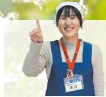
健康管理センター 管理栄養士

暑さに慣れるためには、汗をかくだけでなく、水分や栄養の補給も大事です。汗で失われる水分やミネラル、体力の維持回復の基本となる栄養素を摂取できる、暑さ対策におすすめの料理レシピを紹介します。