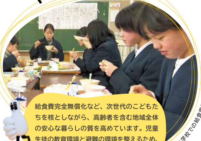
社南小学校での給食風景

子育て、高齢者などへの生活支援、防災・生活基盤の強化などに関する事業を紹介しています。