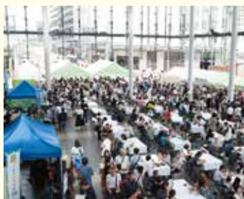
過去のメロンまつりの様子