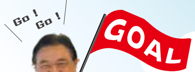
福井市長 西行 茂