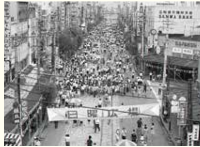
昭和45年の駅前電車通りの様子