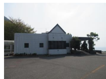
旧水仙ミュージアム