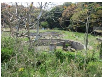
旧野外趣味活動施設 フィッシングセンター跡地