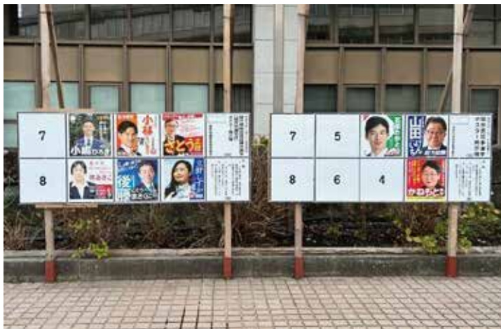
公営ポスター掲示場 福井市役所にて