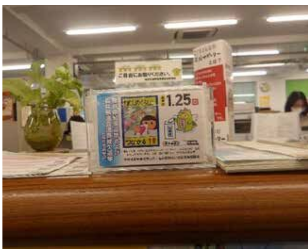
市役所窓口に啓発用ティッシュ設置